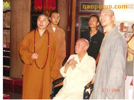
聖一法師禪七開示 聖一法師講述 庚午年臘月於香港虛雲和尚紀念堂(一九九一年一月)