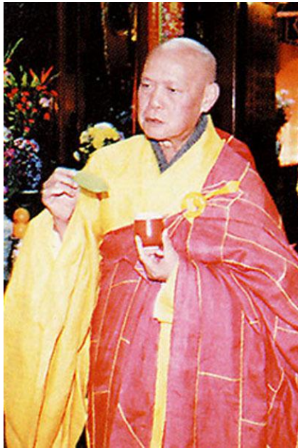
聖一法師方便開示 聖一老法師